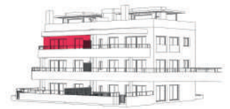
Edificio Amaranto Planta 02/03 - Vivienda B